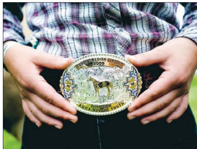
År 2009 vann Janni flest moment i klassen Novice Youth under tävlingen South Swedish Circuit. Då fick hon denna typiska westernaccessoar.

Det finns flera olika grenar inom westernridning, till exempel Western horsemanship, som liknar dressyr, och Trail som ska efterlikna naturen med grindar, broar och stockar som hinder. Janni Torvaldsson sysslar med grenen Reining, där ryttaren rider ett förutbestämt mönster som utgörs av kombinationer av exempelvis galoppombyten, spins (där hästen vänder runt med hjälp av frambenen med stilla bakben) och sliding stops (där hästen bromsar hårt med bakbenen).